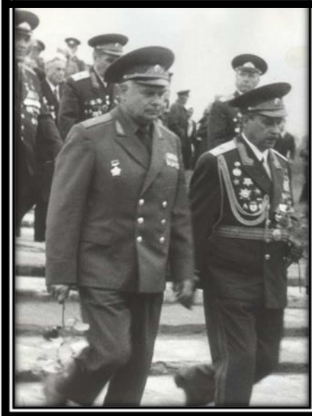
Мемарыяльны комплекс “Рыленкі”