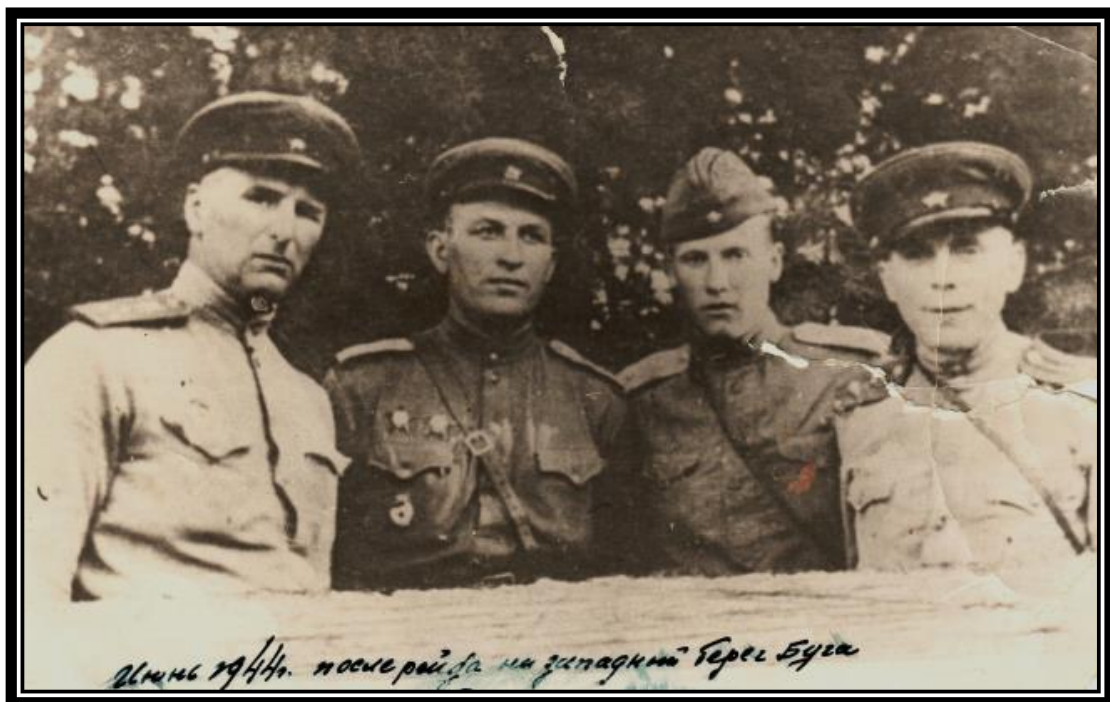
Чэрвень 1941 г. Пасля рэйда на западны бераг Буга.