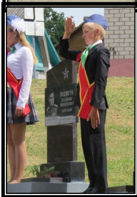
Памятны знак У.П. Падзігуну на Алеі Памяці г. Дуброўна