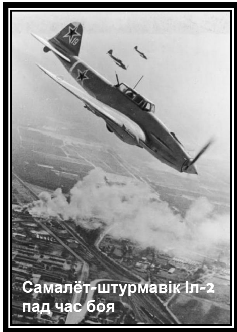
Самалёт-штурмавік Іл-2 пад час боя