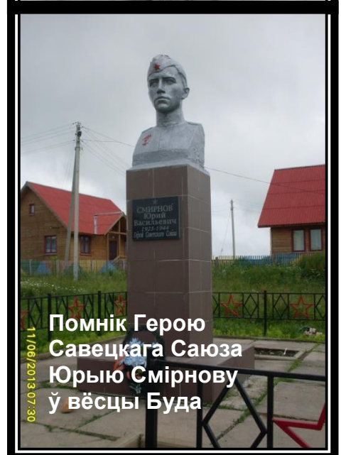
Помнік Герою Савецкага Саюза Юрыю Смірнову ў вёсцы Буда