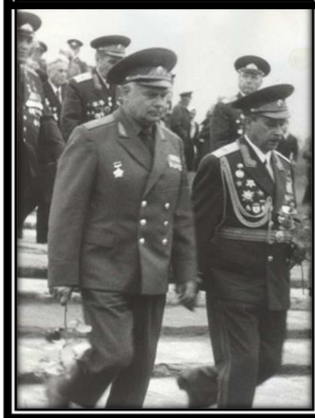
Мемарыяльны комплекс “Рыленкі”